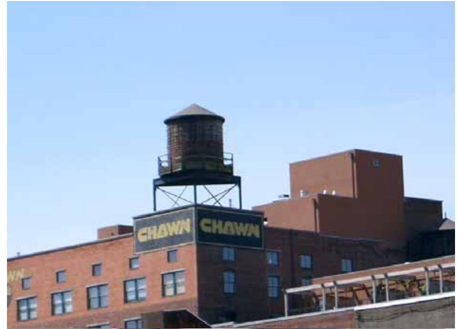
木製の貯水槽 まわりの景色と調和