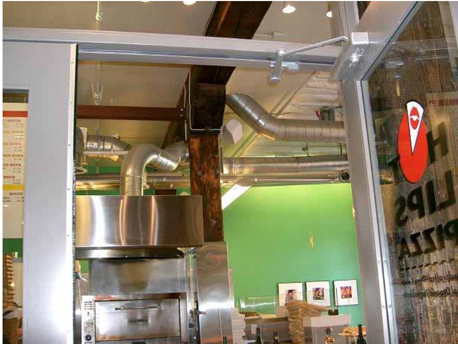
ポートランド市環境部が入っている パタゴニアビル 昔の建物をうまく利用

古いビルや昔から倉庫などもうまく再利用している きれいな内装で、景観もまわりになじんでいるいた