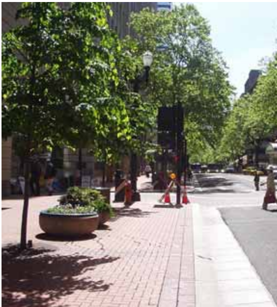
広い歩道(いい写真がない)

レンガ敷きの広い歩道に芸術的なオブジェやデザイン性の高いベンチなどがあり歩行者や観光客を楽しませてくれる。歩くのが楽しい！