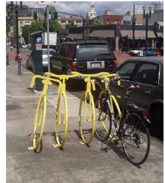
自転車の形をした自転車止め