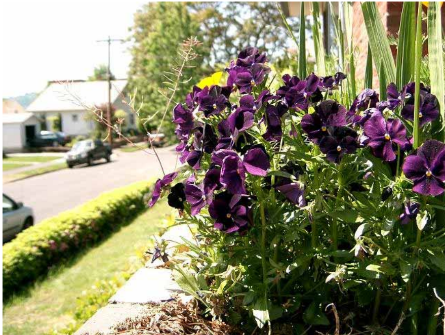
季節の花が歩行者を楽しませてくれる