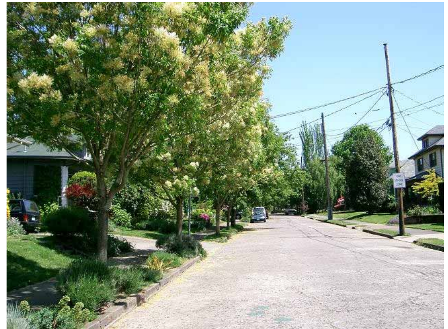
ポートランド市森林局公園課が道の木のコンサルタントをおこなっている